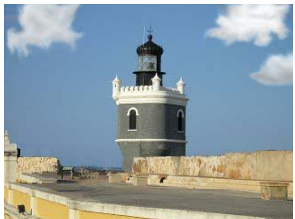
El Faro del Castillo de San Felipe de Morro [1843]

Haciendo un poco de historia, en Puerto Rico se celebró hace muchos años lo que entendemos fue el primer Evento Especial usando unos indicativos especiales asignados por la FCC a la Isla. La actividad conmemoró el 250 Aniversario de la fundación de la Ciudad de San Juan utilizando los indicativos especiales KF4SJ. En aquella época no existía el prefijo "KF4" en los Estados Unidos. Esta actividad se llevó a cabo en el Castillo de San Felipe del Morro y por primera vez se permitió a un grupo de radioaficionados pernoctar dentro del fuerte por 5 días. Recordamos un incidente interesante de la actividad – había que desmontar todas las antenas antes de que el Fuerte abriera las puertas a los turistas cada día. No estaba permitido usar clavos, tornillos o cualquier objeto que perforara las antiguas murallas. Esta restricción nos hizo utilizar la inventiva de todos para poder sostener las antenas. ¡Era tarea diaria instalar las antenas una vez cerrara sus puertas el fuerte al anochecer! La KF4SJ produjo 647 QSOs lo que fue el éxito de la época.