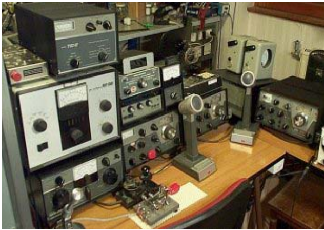
¿Recuerdan esta estación?

Al nacer, nos subimos al tren y nos encontramos con algunas personas las cuales creemos que siempre estarán con nosotros en este viaje—nuestros padres. Lamentablemente la verdad es otra. Ellos se bajarán en alguna estación dejándonos huérfanos de su cariño, amistad y su compañía irremplazable.